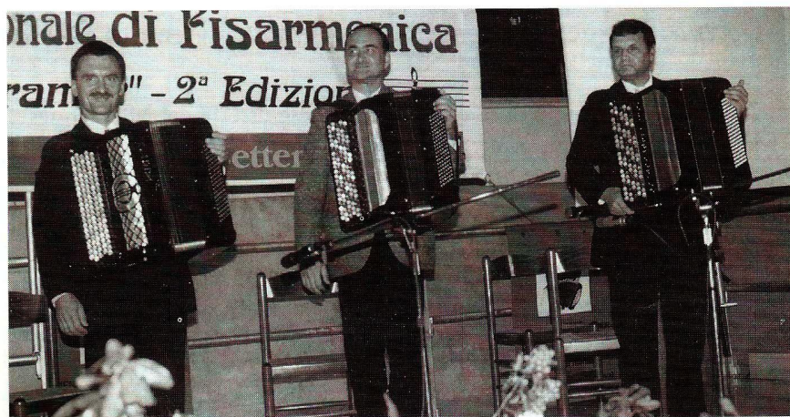
Poggio Rusco - "Biennale Gorni Kramer" - Zitimir Trio Ukraine, primo premio della Cat. 7ª.

L'appuntamento, che sarà reso noto prossimamente, è per la terza edizione nel 2000 con altre novità.