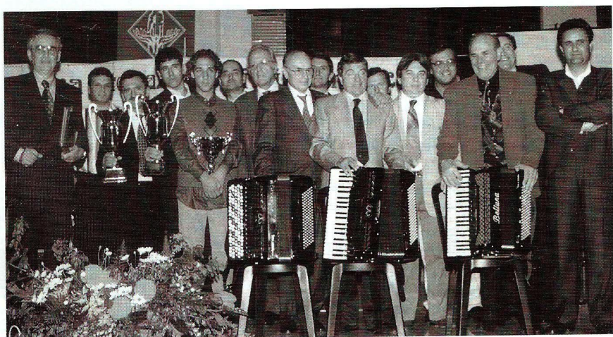
Poggio Rusco - "Biennale Gorni Kramer" - La giuria e i vincitori del concorso.